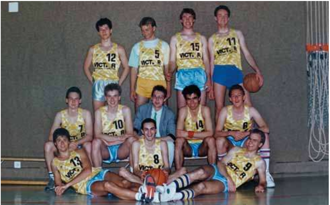
Die Herren Basketball Mutschellen Saison 1986–1987.