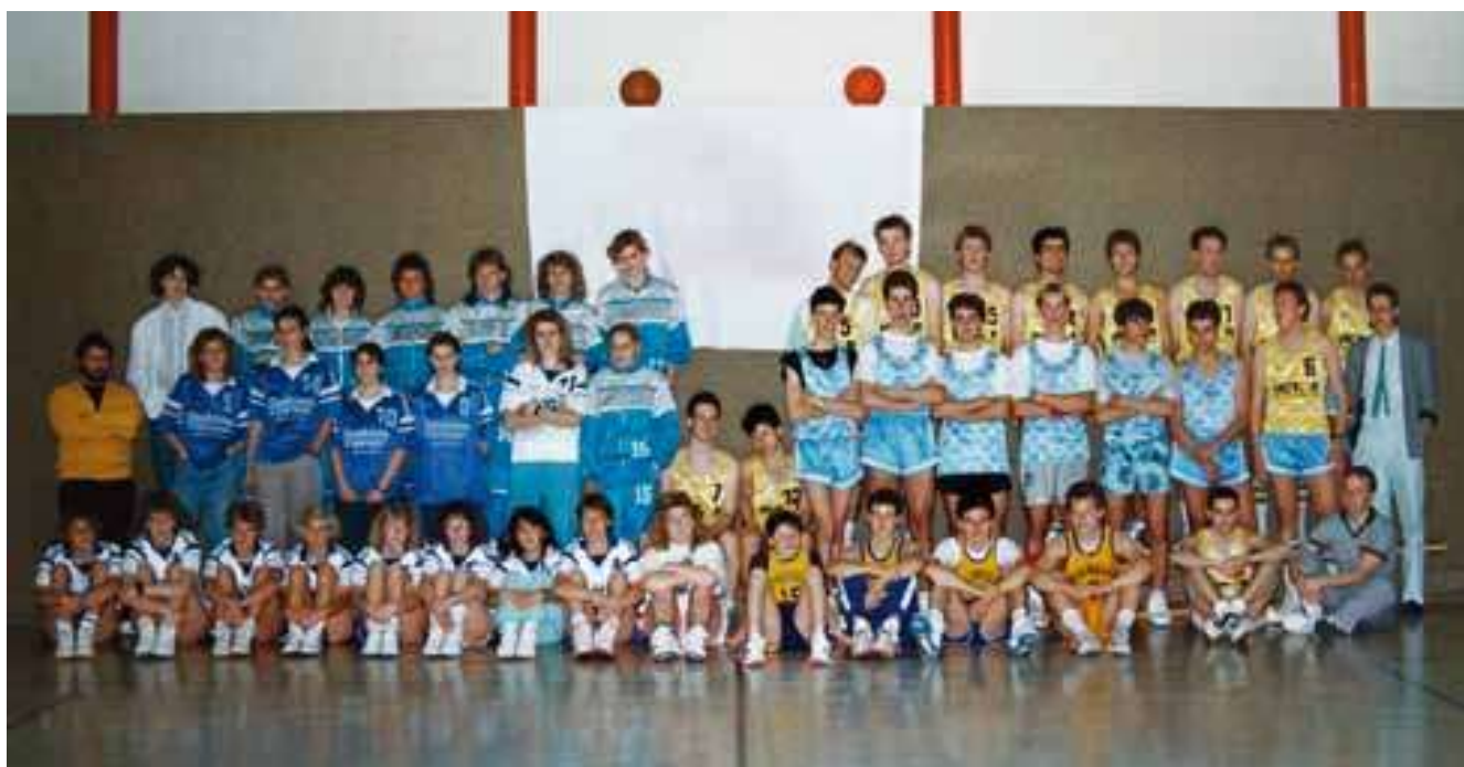
Der Basketball Club Kreisschule Mutschellen BCKSM Saison 1986–1987.